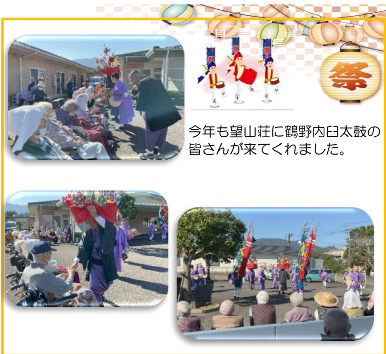
今年も望山荘に鶴野内臼太鼓の皆さんが来てくれました。